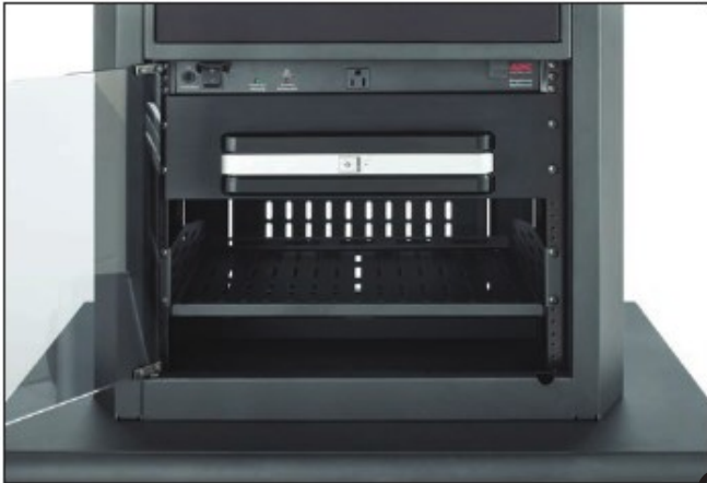
CRS-PLCM-HDX EN UNA RPS-800

Estos entrepaños para rack han sido especialmente diseñados para los códecs LifeSize®, Polycom® y Tandberg®; pueden instalarse en las mesas RPS-1000SE, RPS-1000LE, RPS-800L/S y la línea GMP de AVTEQ.